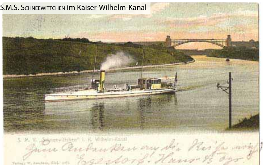
S.M.S. SCHNEEWITTCHEN im Kaiser-Wilhelm-Kanal

Während der Zeit der Kaiserlichen Marine wurden Mützenbänder in den Farben Gold, Silber und Rot getragen. Die Bänder mit goldfarbener Beschriftung wurden vom seemännischen, die mit der silberfarbenen vom technischen Personal getragen. Bänder mit roter Beschriftung trugen die Schiffsjungen.