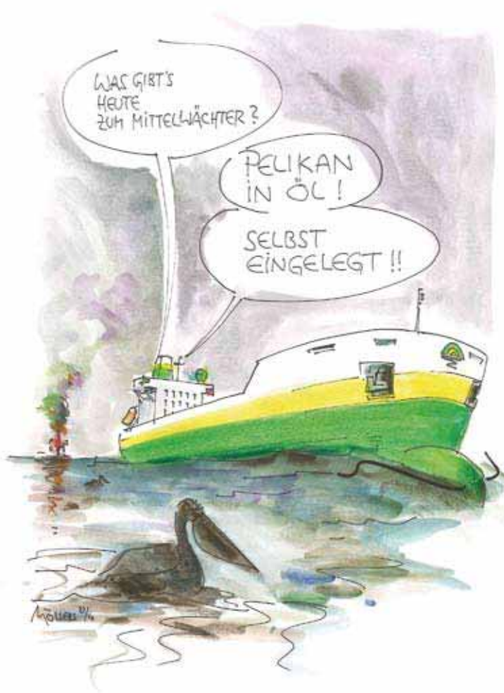
Zeichnung: Friedrich Möllers

Nach den eher futuristisch anmutenden Mega-Yachten der jüngsten Zeit glänzt Blohm + Voss jetzt mit einem neu entwickelten Yacht-Typ, der mit seinen formschönen Linien und zwei Schornsteinen Erinnerungen an die dreißiger Jahre weckt. B+V 111 MY VINTAGE lautet die offizielle Bezeichnung. Bei einer Länge von 111 Metern, einer Breite von 15,6 Metern und 5,30 Meter Tiefgang besteht der Antrieb aus zwei jeweils 2.560 kW leistenden Dieselmotoren für eine Höchstgeschwindigkeit von 17 Knoten. Zur Ausstattung gehören jeweils zwei zehn Meter und 8,5 Meter lange Begleitboote, die für Ausflüge genutzt werden können, sowie ein Hubschrauberlandedeck. Außer den Eignerräumlichkeiten bietet die Yacht Platz für bis zu 14 Passagiere und 25 Besatzungsmitglieder. Als besonderes Detail nennt Blohm + Voss eine Aussichtsplattform unterhalb des hinteren Mastes, von der aus die Passagiere einen sehr guten Überblick über die Yacht selbst und die sie umgebende See haben. Damit das alles ganz bequem bleibt, ist die Plattform mit einem Fahrstuhl zu erreichen. bjw