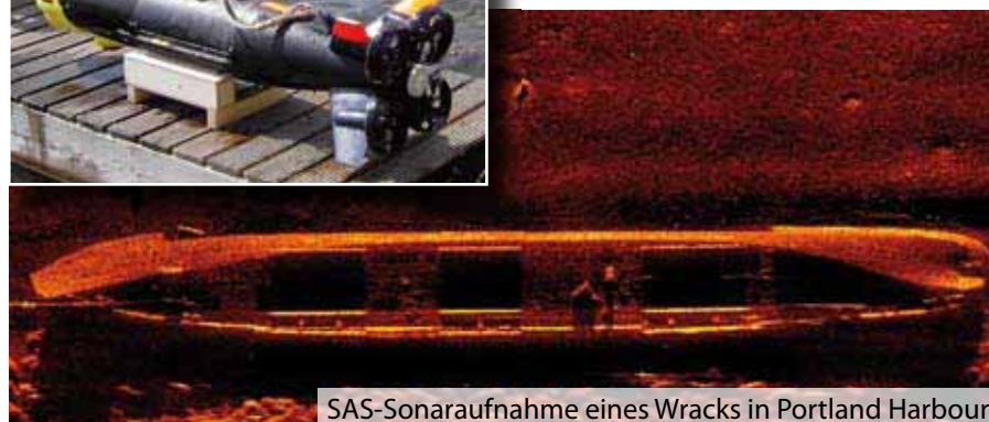
SAS-Sonaraufnahme eines Wracks in Portland Harbour

cken. Hierbei wurden die Sonardaten des autonomen Unterwasserfahrzeugs SeaWolf aufgezeichnet. Die 2 m lange und nur 110 kg schwere Drohne inspizierte vollautomatisch das Gebiet in der Nähe des Piers an der Wendepalte der Fähren. Bei der Auswertung der aufgezeichneten Sonardaten gab es anschließend eine Überraschung. Neben kleinen Artefakten wurde auch ein Objekt mit einer Kantenlänge von