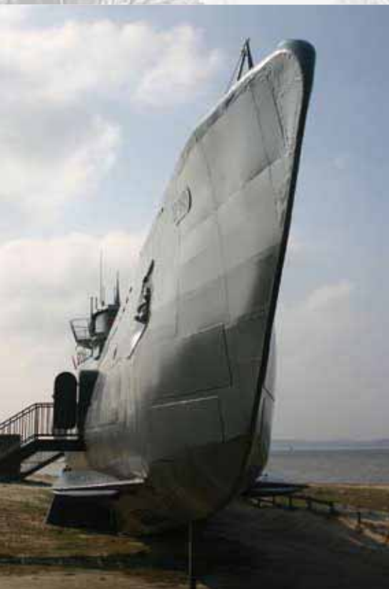
U995 wurde 2010 aufwendig saniert