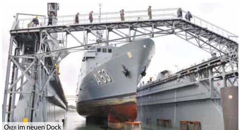
OKER im neuen Dock

den. Das Dock kann die Einheiten der Marine außerdem mit Strom, Druckluft und Telefon versorgen. Die Ablieferung war ursprünglich im Herbst 2008 geplant, war aber aufgrund von technischen Problemen sowie der folgenden Insolvenz der Lindenau Werft mehrfach verschoben worden. Mit der Dockung der OKER ist der erste Teil der Abnahmeprüfung bestanden. Jetzt müssen noch eine Fregatte und ein U-Boot gedockt werden. Text & Foto: fb