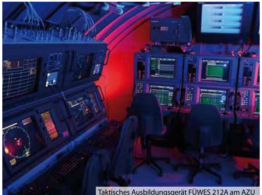
Taktisches Ausbildungsgerät FÜWES 212A am AZU

Ein weiterer Eckpunkt der U-Bootausbildung am AZU ist die Teamaus-