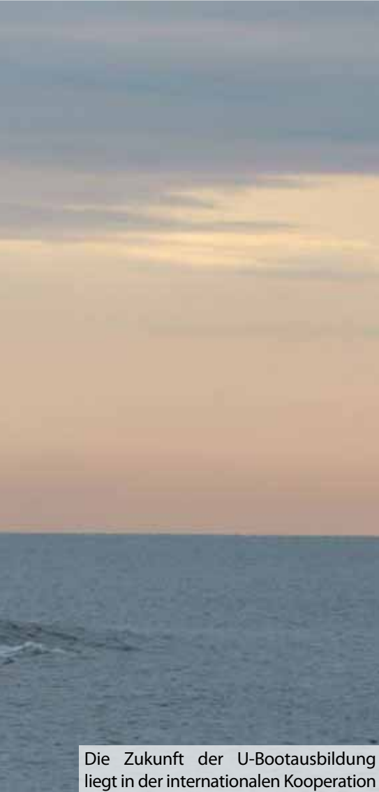
Die Zukunft der U-Bootausbildung liegt in der internationalen Kooperation

und begann ab 1906 mit den Erprobungen eines eigenen Unterseebootes (S.M.S. U1). Obwohl in der Marineführung der Nutzen des U-Bootes als Seekriegsmittel immer noch kontrovers diskutiert wurde, setzten sich die fortschrittlich denkenden Köpfe durch, der Serienbau wurde begonnen. So konnte im Oktober 1910 die 1. Ubootflottille in Kiel mit acht Booten aufgestellt werden. Wenige Tage später, am 10. Oktober 1910, legte eine „Allerhöchste Kabinettsorder“ den Grundstein für die erste Ausbildungseinrichtung deutscher U-Bootfahrer. Die Notwendigkeit einer entsprechenden Ausbildung wurde früh erkannt; zu neu war das System U-Boot mit seiner vielfältigen technischen Ausstattung, zu komplex waren die Bedienerabläufe und Sicherheitsprozeduren. Die Schule wurde auf dem U-Boot-Hebeschiff VULCAN eingerichtet, das mit seiner auffälligen Doppelrumpfsilhouette den Hafen von Eckernförde prägte. Dessen Kommandant leitete zugleich die U-Bootschule.