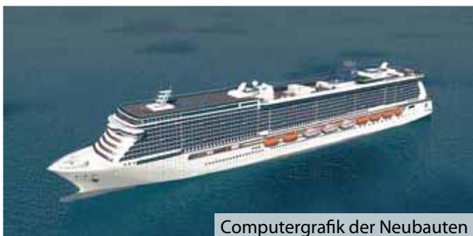
Computergrafik der Neubauten

Die Papenburger Meyer Werft, die zu den wenigen Werften in der Welt zählt, die große Passagierschiffe in Perfektion bauen können, hat in der gegenwärtig schwierigen Zeit einen neuen wichtigen Akquisitionserfolg erzielen können: Die Norwegian Cruise Line (NCL), ein alter Kunde des Unternehmens, hat zwei weitere Neubauten bestellt. Sie werden mit ihrer Größe von 143.500 GT jeweils über 4.000 Passagieren Platz bieten und sollen 2013 bzw. 2014 abgeliefert werden. Der Gesamtauftragswert wird mit 1,2 Mrd. Euro angegeben. bjw