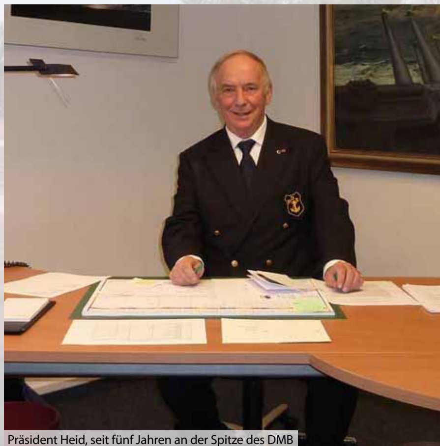
Präsident Heid, seit fünf Jahren an der Spitze des DMB