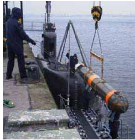
Ausbildung an der Torpedobeladeeinrichtung

Am 31. August 1989 wurde die Ubootlehrgruppe in das Ausbildungszentrum Uboote (AZU) umgewandelt und mitsamt den Ausbildungsanla-