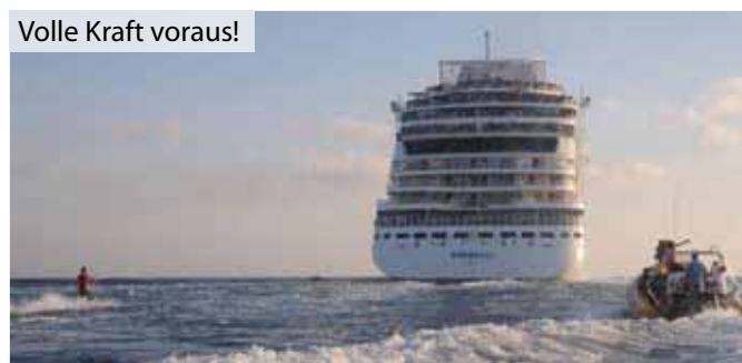
Volle Kraft voraus!

Es ist schon eigenartig, was sich Leute so einfallen lassen, um beispielsweise im Guinnessbuch der Rekorde einen Platz beanspruchen zu können. Einen der jüngsten Fälle, die in diese Kategorie gehören, leistete sich die AIDA-Reederei mit ihrer AIDABELLA, das nun für sich reklamieren darf, das größte Kreuzfahrtschiff zu sein, das jemals einen Wasserskiläufer auf dem Haken hatte. Vor der spanischen Küste in der Bucht von Alicante zog das Schiff einen Reporter der TV-Sendung „Galileo“ bei einer Geschwindigkeit von 14 Knoten genau sechs Minuten und 25 Sekunden am Seil durch das ruhige Meer. Selbstverständlich dokumentarisch nicht nur für den begehrten Bucheintrag, sondern auch gleich für das Fernsehen festgehalten. bjw