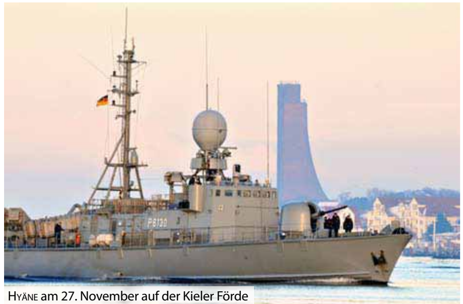
HYÄNE am 27. November auf der Kieler Förde

Das Schnellboot S 80 HYÄNE ist wieder einsatzbereit. Die Tamsen-Werft in Rostock-Gehlsdorf hat das Schnellboot innerhalb von zehn Tagen repariert. Am 27. November 2010 verließ die HYÄNE nach erfolgreicher Erprobung Rostock und nahm Kurs auf Kiel. Durch den Nord-Ostsee-Kanal führte die Reise in Richtung Nordsee und weiter ins Mittelmeer. Mitte Dezember nahm das Schnellboot seinen Platz im deutschen Unifil-Kontingent vor dem Libanon ein. Diesen Platz hat dort am 27. November nach fast neun Monaten der Kieler Minenjäger KULMBACH freigemacht. Die KULMBACH trat von Limassol aus die Heimreise an. Im Bereich Spanien traf die KULMBACH auf die entgegenkommende HYÄNE. Dieses Treffen sollte eigentlich am 24. November in Limassol erfolgen. Die HYÄNE war am 5. November in Warnemünde ausgelaufen, musste aber die Fahrt am 6.