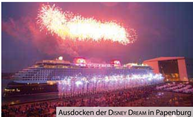
Ausdocken der DISNEY DREAM in Papenburg

Am 9. Dezember 2010 hat die Meyer Werft mit der DISNEY DREAM das erste von zwei Kreuzfahrtschiffen an die Disney Cruise Line, Orlando/USA übergeben. Dieser mit 128.000 GT vermessene 340 Meter lange und 37 Meter breite Neubau ist das größte bisher in Deutschland gebaute Passagierschiff. Mit seinen 340 Metern Länge zählt es sogar zu den drei längsten in der Welt. Leistungsstarke Motoren erlauben eine Geschwindigkeit von 23,5 Knoten. 4.000 Passagiere finden auf dem mit vielen technischen Feinheiten ausgestatteten Schiff Platz. Dazu gehört eine Wildwasserbahn von 245 Metern Länge, die erste auf See überhaupt. Nach dem Ausdocken in Papenburg erfolgte die Überführung in das niederländische Eemshaven zur Erledigung der üblichen Restarbeiten und Durchführung der Probefahrten. Die Abschlussdockung wurde bei Blohm + Voss Repair in Hamburg erledigt. Für den 26. Januar ist die Jungferntour der DISNEY DREAM von ihrem Heimathafen Port Canaveral in Florida aus zu den Bahamas geplant. bjw