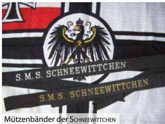
Mützenbänder der SCHNEEWITTCHEN

rer Marine wieder, so wie: KÖLN, EMDEN oder KARLSRUHE. Kaum jemand würde also auf die Idee kommen, dass eines der Boote Kaiser Wilhelms II. auf den schönen Namen SCHNEEWITTCHEN getauft worden ist. In der Regel wurden Kriegsschiffe mit den Namen von ehemaligen See- oder Kriegshelden, Figuren aus der Mythologie, nach bekannten Fürstenhäusern oder Städten getauft. Aber in diesem Fall gab es eine Namensgebung, die völlig aus dem Rahmen fiel. Mit Allerhöchster Kabinettsorder vom 17. August 1875 wurden Richtlinien erlassen, nach welchen Gesichtspunkten die unterschiedlichen Schiffsklassen zu benen-