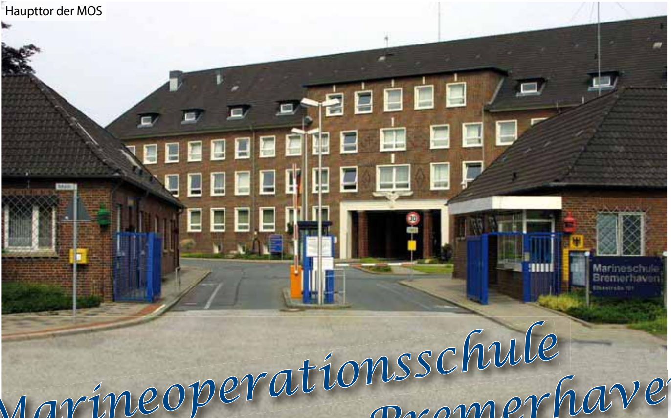
Hauptide der MOS