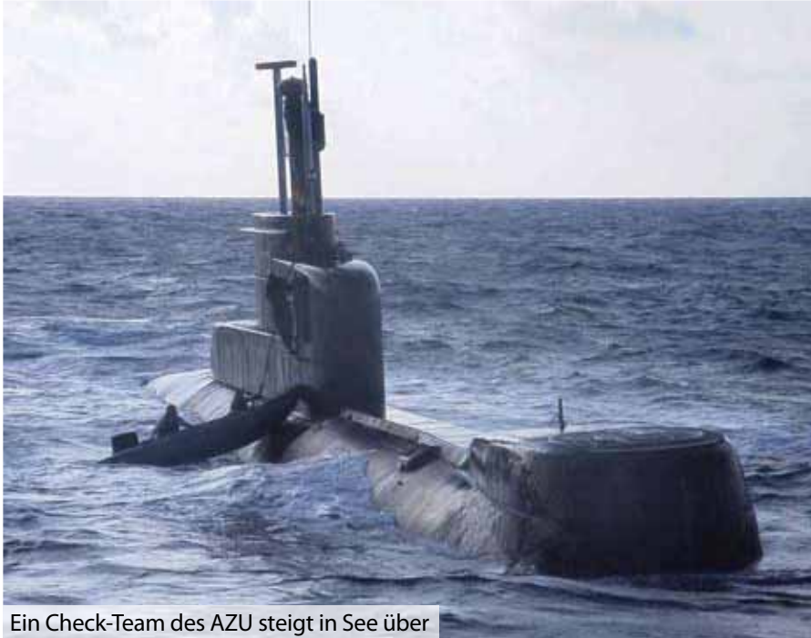
Ein Check-Team des AZU steigt in See über

bildung. Ob Tiefensteuern oder OPZ-Dienst, hier wird der bislang individuell ausgebildete U-Bootfahrer in sein zukünftiges Team integriert. Als Ausbildungsmittel dienen dabei primär das eingangs erwähnte FÜWES 212A für die taktische Arbeit sowie der dreidimensional bewegliche Tiefensteuersimulator.