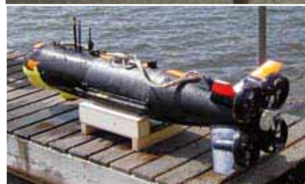
SeaOtter Mk II (oben) und SeaWolf (l.)