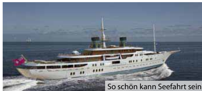
So schön kann Seefahrt sein