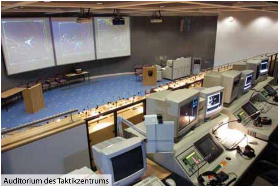
Auditorium des Taktikzentrums