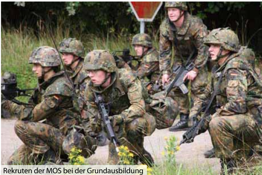
Rekruten der MOS bei der Grundausbildung

gangsteilnehmer lernen ständig an der Schule. Neben der Grundausbildung für Funker, Signaler, Navigatoren und Operateure wird in einem breiten Spektrum die bedarfsgerechte und einsatzorientierte Aus- und Weiterbildung aller Dienstgradgruppen in fast allen Belangen der Einsatzführung durchgeführt. Darüber hinaus finden im Taktikzentrum hochrangige Seminare statt. Teilnehmer sind Flag- und Staboffiziere aus dem Flottenkommando, den beiden Einsatzflottillen und aus dem Ausland.