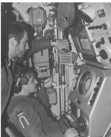
Vor 25 Jahren prägte noch analoge Technik die Ausbildung

„Leinen los!“ schreibt U-Boot nach Duden, die amtlichen Bezeichnungen der Marine wie z.B. Ubootflottille bleiben natürlich unverändert.