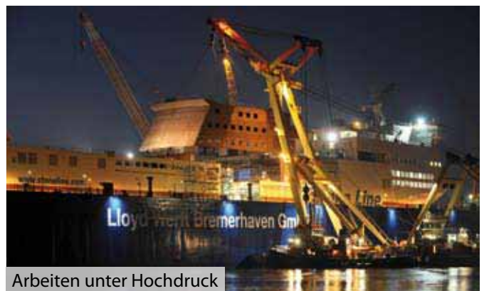
Arbeiten unter Hochdruck

Der Auftrag ist jedoch nicht allein auf die Verkürzung der beiden Schwesterschiffe durch Heraustrennen eines Mittelteils beschränkt, sondern umfasst auch die erhebliche Ausweitung der Passagierkapazität von derzeit 300 auf 1.000, was deutlich vergrößerte Aufbauten erfordert. Darüber hinaus wird eine zweite Heckrampe installiert und die bestehende modifiziert. Zusätzlich erhalten beide Schiffe eine Bugpforte, die es ermöglicht, dass Fahrzeuge direkt durch die Schiffe ein- und ausrollen können. Der Einbau von fünf Hängedecks bietet Platz für die Aufnahme weiterer Pkw. Ein drittes Bugstrahlruder wird die Manövrierfähigkeit im künftigen Fahrtgebiet der kanadischen Inseln noch verbessern. Für die Umbauzeit, also die Realisierung eines völlig veränderten Konzepts, war pro Schiff 55 Tage angesetzt. bjw