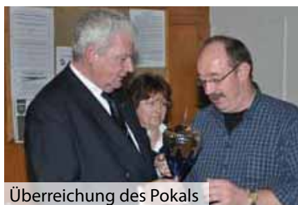
Überreichung des Pokals