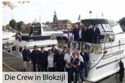
Die Crew in Blokzijl

Text: Günter Heidrich