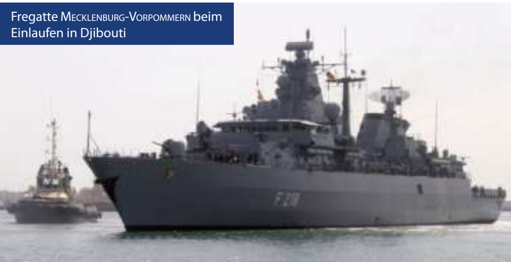
Fregatte MECKLENBURG-VORPOMMERN beim Einlaufen in Djibouti