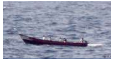
Ein Speedboot vor der Küste Somalias

den werden. Aber bereits am nächsten Tag wird erneut Alarm gegeben. Die Vorfälle ereigneten sich etwa 650 Kilometer nordöstlich von Djibouti im