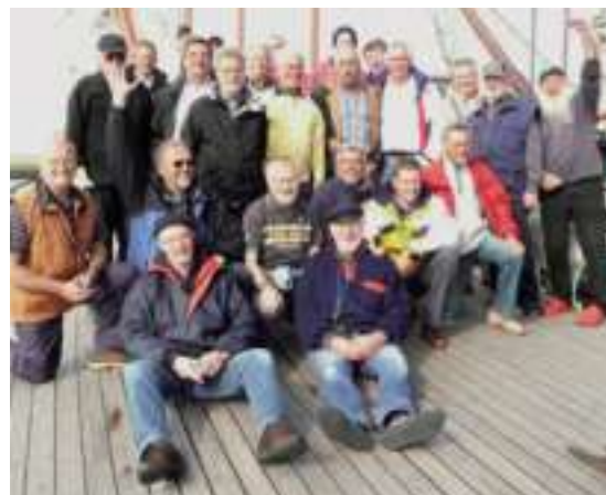
Die echten Seebären der MK Lüdenscheid