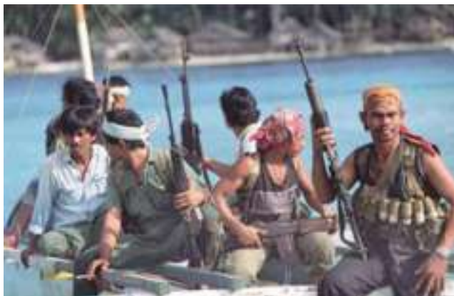
Piraten stellen eine große Gefahr für die Schifffahrt dar

Drittens: Es liegen erste Hinweise darauf vor, dass sich organisierte Kriminelle und Kaufleute aus dem Nahen Osten mit Kapital im „Piraterie-Business einkaufen“. Damit droht eine internationale Netzworkebildung und Professionalisierung ähnlich der, die zwischen 1990 und 2005 in Asien zu beobachten war. Nachrichtendienstliche Erkenntnisse sprechen zudem erstmals deutlich von Verbindungen zwischen den muslimischen Piraten am Horn von Afrika mit islamistischen Terroristennetzwerken, es existieren erste Hinweise darauf, dass Piraten mit Geld und Waffen unterstützt werden könnten.