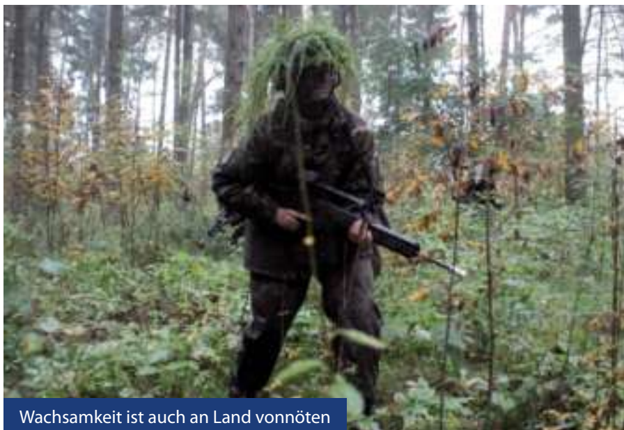
Wachsamkeit ist auch an Land vonnöten

menden Monate und Jahre vorwiegend ganz anderen Ausbildungsinhalten gewidmet werden. Dennoch ist auch sie mit einem guten Gefühl nach Ende des Lehrgangs abgereist. „Wir haben schon sehr viel gelernt, auch wenn ich denke, dass ich mit diesem Wissen nicht gerade einen Einsatz in Afghanistan antreten wollte“, beschreibt sie den Eindruck, wohl wissend, dass dies ohne weitere Ausbildung auch nicht in Frage kommen kann.