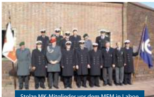
Stolze MK-Mitglieder vor dem MEM in Laboe

rhein sowohl das Marine- als auch das U-Boot-Ehrenmal und legten zu Ehren der auf See gebliebenen Kameraden einen Kranz und ein Gebinde nieder. Die Schiffsmodell-Ausstellung, der Blick vom Turm und die U-Boot-Besichtigung waren sehr beeindruckend. Auch der Klönschnack mit der dortigen U-Boot-Kameradschaft war ein tolles