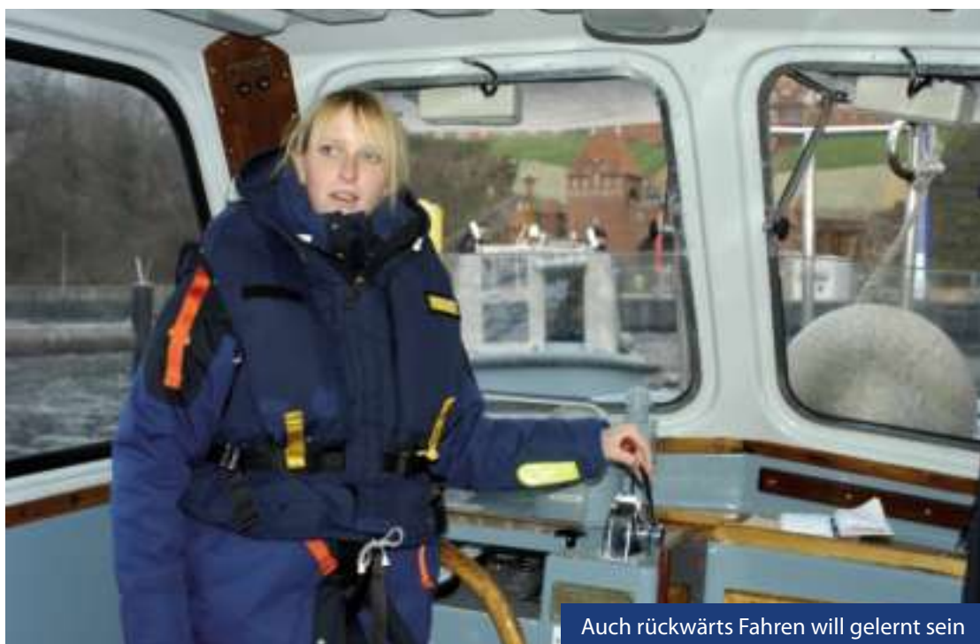
Auch rückwärts Fahren will gelernt sein